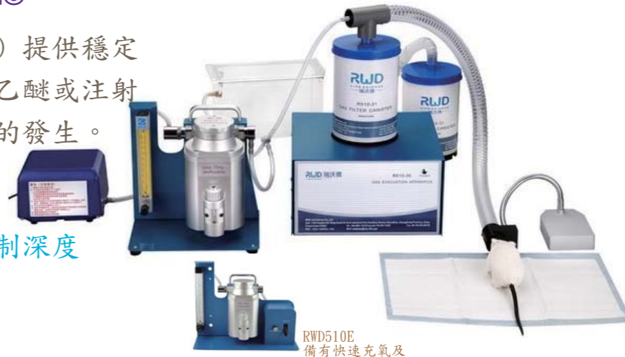
RWD510E 備有快速充氧及誘導盒及氣體面罩間管路轉換系統

RWD提供各式氣麻設備、氣體回收系統、面罩、空氣幫浦、五通道流量表、誘導盒等另有小型動物、大型動物、移動式等各式麻醉系統