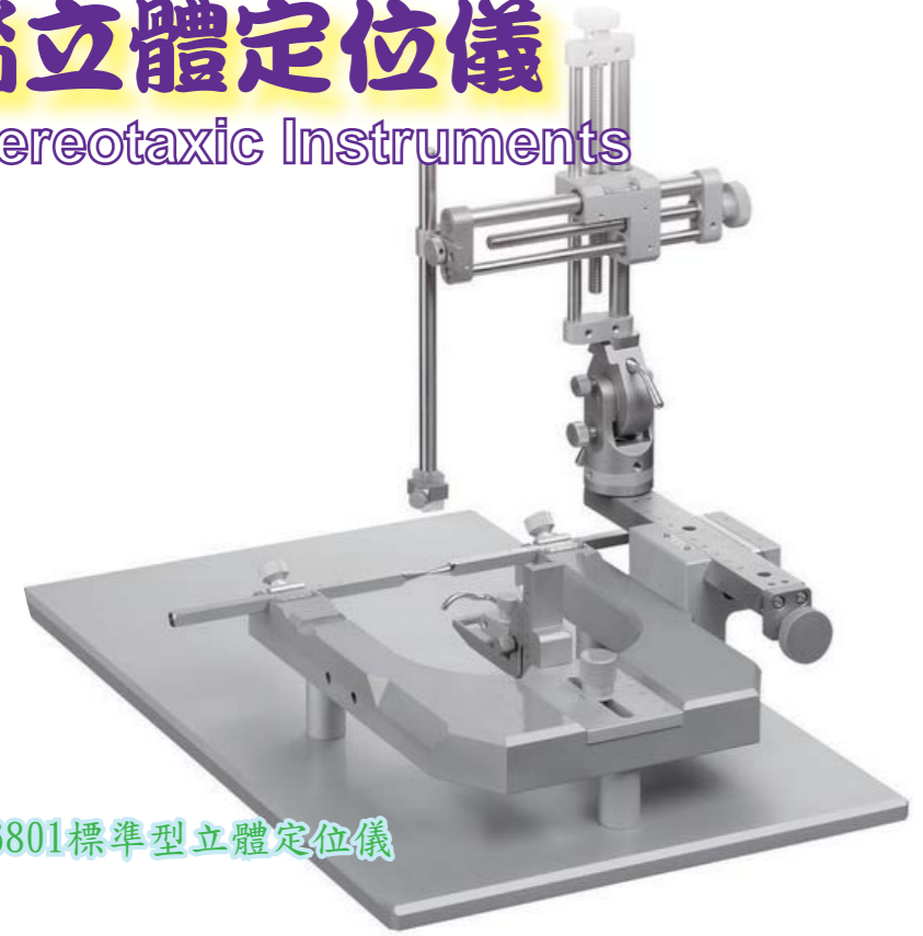
6801標準型立體定位儀