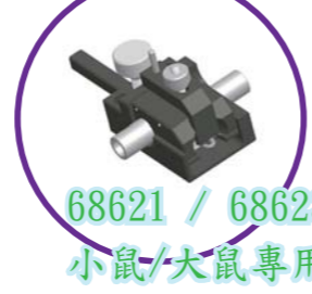
68621 / 68623 小鼠/大鼠專用氣麻面罩

另有單臂式、雙臂式、數位式、旋轉型、輕便型、大型動物（狗/猴）等規格，符合各式研究需求