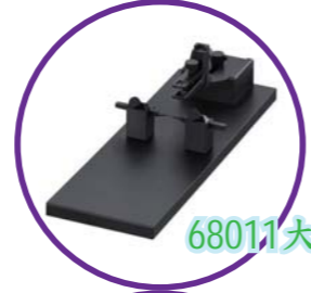
68011大鼠 MRI Adaptor